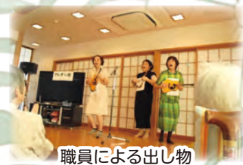
職員による出し物

旬の食材を取り入れ、季節折々の伝統行事を感じ、楽しんで頂けるようにしています。食事を摂りにくい方に対しては、調理方法を変更して柔らかくしたり、食器をかえてご自分で召し上がることができるように変更しています。サンライフで多くの方と一緒に食事を楽しみながらしっかり食べておられます。