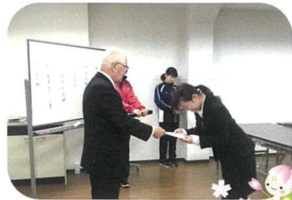
とてもフレッシュな新入職員が3名も入社致しました。皆さま、暖かく見守って下さい