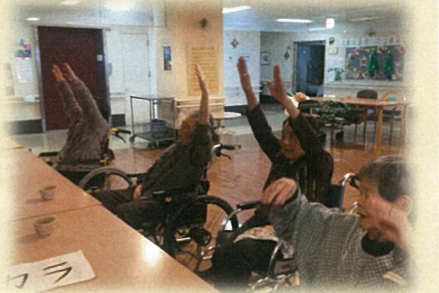
食堂での体操風景

インドネシアから技能実習生として介護の現場に配属されました。 宜しくお願い致します。