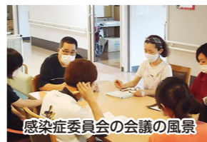
感染症委員会の会議の風景

で暮らす高齢者のための総合相談窓口です。地域を地盤に仕事をさせて頂いている私達にとつて、皆様の日頃のご理解、ご協力は宝です。地域からの情報提供のおかげで早期解決につながったことも少なくありません。感謝申し上げます。地域の小さな声に気付けるセンターでありたいですが、皆様からも発信して頂ければ、とても助かります。どうか地域のことを教えて下さい。ご自身のことだけでなく、身の周りにおられる高齢者のこと。また、なにか地域活動をした方、コロナ禍の折、動きづらい状況かと思いますが、皆様と相談させて頂きながら、御一緒に地域の中で活動していきましょう。