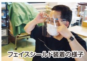
フェイスシールド装着の様子

職員の手洗いうがいの周知徹底をいかに維持継続できるか。モチベーションの維持の方法等意見を出し合いより良い環境作りを目指しています。