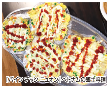
「バインチャン ニュオン」ベトナムの郷土料理

コロナ禍において行事を行うのは大変でしたが、皆様の笑顔にふれあえて、楽しい一日を過ごすことが出来、職員一同嬉しく感じています。