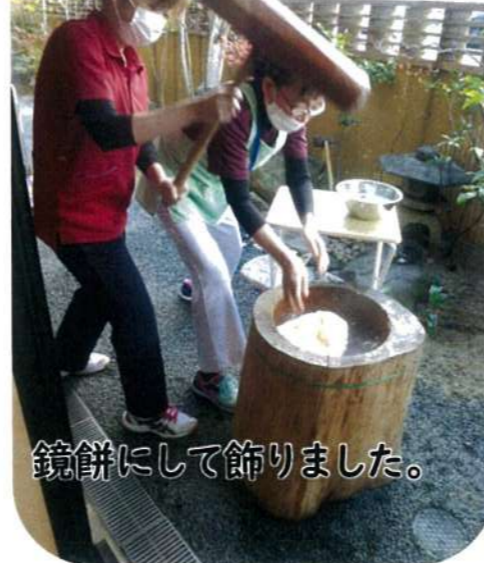
鏡餅にして飾りました。

新型コロナウイルスの脅威に晒されながら私たちは重症化リスクのある高齢者を支援しています。換気や消毒、マスクを着用しながら感染リスクを減らす努力をしています。以前のような生活ができる日々が来ることを願っています。