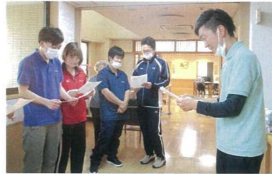
集まりやすい朝礼後、作成したマニュアルを使ってミニ研修を実施、情報共有に努めました。