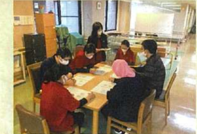
①排泄介助のマニュアルの見直しと研修会