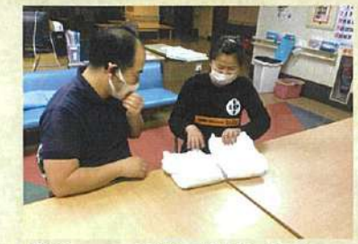
②オムツの種類の比較と検討

【まとめ】 日々変化していく入居者様の状態に合わせた対策を実践する事が入居者様の毎日の生活自体を快適なものへと導くことが出来、生活そのものが活性化し、私たちの願いであった入居者様の笑顔に繋がるということが結果として現れ、大きな達成感となりました。 今後も入居者様の『笑顔』の為に、サークル活動で取り組み実践してきたことを維持・継続し、さらなる工夫が出来るようメンバー一同精進して参ります。