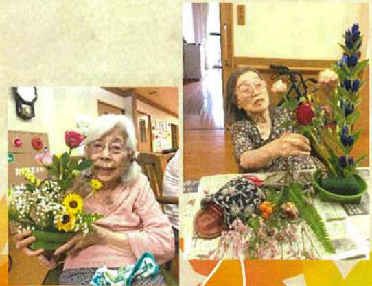
毎回20名以上の方が参加されています