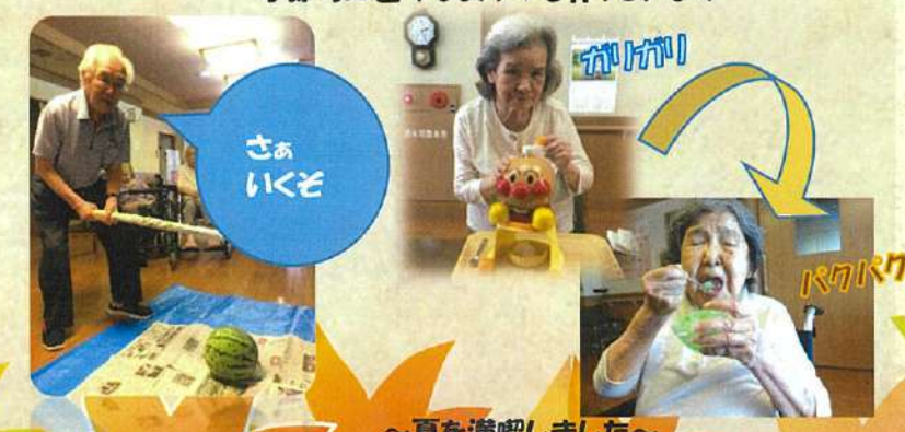
～夏を満喫しました～ 施設で栽培したスイカ割り＆かき氷作り🍧