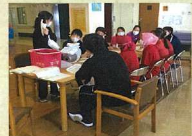
①オムツの使い方実践・研修会風景

現状平均値 12.5% を 8.8% に！！ 目標平均値 10.0%よりも3.7%下回り 目標達成をしました。