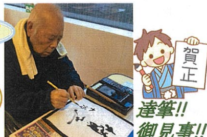
賀正 達筆!! 御見事!!