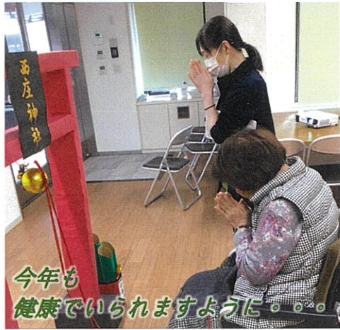
今年も健康でいられますように。。。