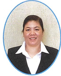
特別養護老人ホーム サンライフ御立 ヴォ ホン ハイ イエン