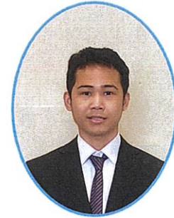
特別養護老人ホーム サンライフ御立 オニ アグスティヤン