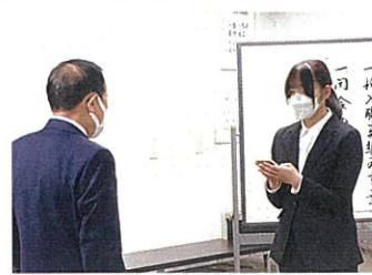
新入職員誓の言葉