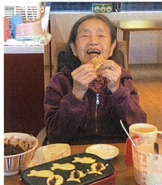
出来立て美味しい♡