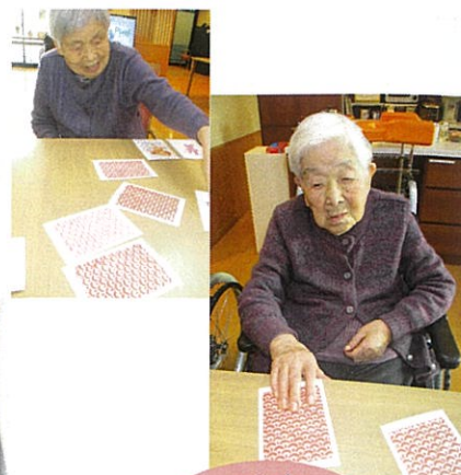
干支 かるた 職員の手作り