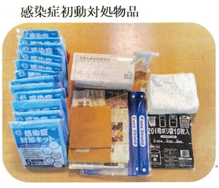
感染症初動対処物品

令和4年12月12日の会は、ガウンテクニックを実施しました。 改めて、感染症予防対策(マニュアル)の確認。コロナウイルス、インフルエンザ、ノロウイルス感染者の緊急対応の確認。ガウン、手袋、マスクの装着と脱着の実地演習を行いました。 令和5年1月31日の会は、感染症初動対処物品を各部署で準備と、物品場所の把握することを話し合いました。それにより特に職員が少ない時間帯(夜間、休日等)に慌てて探すことなく、円滑な使用、安全かつ安心して対応に臨むことができました。 皆が健康管理に気を配り、職員が持ち込まないように手洗い・うがい・消毒を徹底し、今後も入所者様の安全を守っていただけるよう、職員一同励んでいきます。