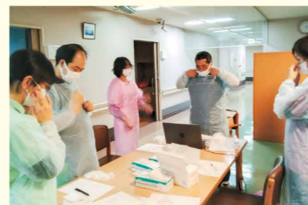
ガウンテクニックの実施演習

令和4年12月12日の会は、ガウンテクニックを実施しました。改めて、感染症予防対策(マニキュアの確認。コロナウイルス、インフルエンザ、ノロウイルス感染者の緊急対応の確認。ガウン、手袋、マスクの装着と脱着の実地演習を行いました。