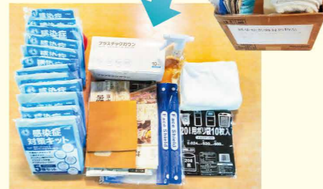
感染症初動対処物品(感染症対策キット) ●キャップ、マスク、ガウン、手袋、シューズカバー 各12組 ●ガウン 10枚入り1箱 ●スプレーボトル 1個 ●ゴミ袋 ●フェイスシールド 5枚 ●ノロウイルス対策用 (新聞紙、段ボールのへら 2枚、タオル 2枚)

令和5年1月31日の会は、感染症初動対処物品を各部署で準備と、物品場所の把握する事を話し合いました。それにより特に職員が少ない時間帯(夜間、休日等)に慌てて探すことなく、円滑な使用、安全かつ安心して対応に臨むことができます。皆が健康管理に気を配り、職員が持ち込まないよう手洗いうがい、消毒を徹底し、今後入所者様の安全を守っていきけるよう、職員一同励んでいきたいと思えます。