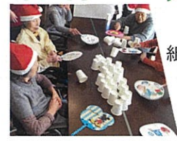
紙コップを団扇で仰いで陣 りゲーム！ とても盛り上がり ました。