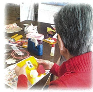
正月飾りを作りました。