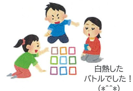
白熱した バトルでした！ (*^*)