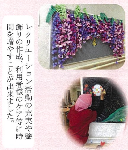
レクリエーション活動の充実や壁飾りの作成、利用者様のケア等に時間を増やすことが出来ました。

利用者様の衣類に関わる作業時間、現状値(百二十五、七分/日)を目標時間三十%低減 対策後 ← 対策後の作業時間現状値(八十一、七分/日)目標時間三十五%もダウンし、目標値よりも下げることが成功しました。