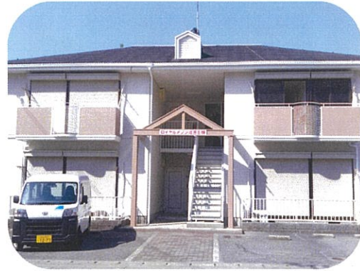
ロイヤルメゾン辻井E棟