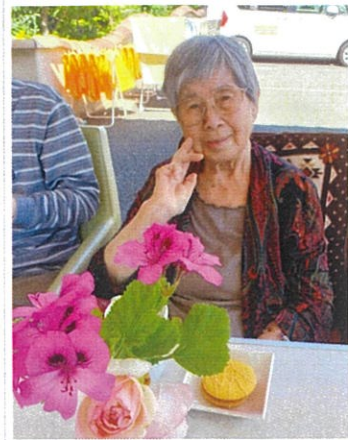
サンライフ田寺 玄関先で優雅なお茶会♪