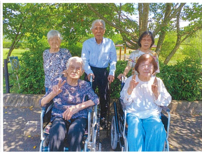
紫陽花鑑賞後に森林浴をして 過ごしました