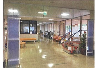
利用者様がフロアにいる時は閉めています。エアコンが循環するようにしています。

アコーディオンカーテン取り付けただけで冷房の効きがよくなり業務がしやすくなりました。実際に冷房を使用し始めたばかりなので、今後電気代の節約にもつながれば嬉しいです。