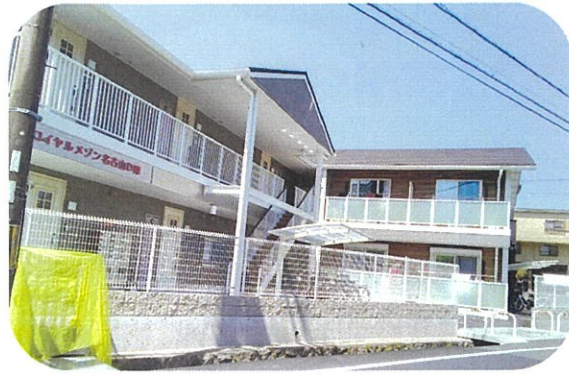
ロイヤルメゾン名古屋D棟

職員の中に、ベトナム、インドネシア、ミャンマーの国々から来日し介護に従事しています。そして、新たにネパールから来日した専門学校生も加わり、職場がますます明るく賑やかになっています。日本の生活に慣れるまでには時間がかかるかもしれませんが、皆でお互いにサポートし合い、働きやすい環境を築いていけるよう努めています。