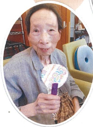
「うちのキーホルダー」作り