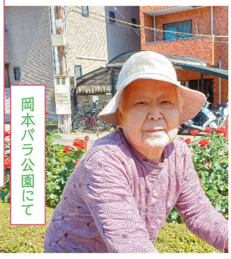
岡本バラ公園にて