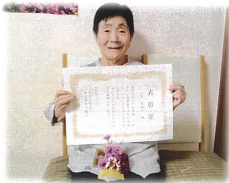
300 ポイント達成！表彰状と豪華景品と一緒に記念撮影