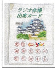
ラジオ体操のポイントカード

ケアハウスサンライフ御立では、月々金曜日の午前九時十五分から、ラジオ体操もしくは、いきいき百歳体操を実施しています。 しかしながら参加人数の伸び悩みが最近の課題となり、平均三、四人ほどしか集まりませんでした。ひどい時は0人という日もありました。 そこで、子供頃の夏休みの思い出の一つでもある「ラジオ体操スタンプカード」を作ってみました。 ラジオ体操を「ポイント」、いきいき百歳体操は週に一回あり、三ポイント。誕生日月と二十日は、ポイント二倍デーという設定で行った結果参加人数が二倍以上の参加者増加し、三百ポイント達成者には豪華景品のプレゼント！とても喜ばれていました。表彰状も喜ばれ、お部屋に飾って頂いています。 毎日体操は、皆さんの健康にも繋がります。穏やかに過ごせる日々を願います。いろいろな行事を増やせられたらと思います。